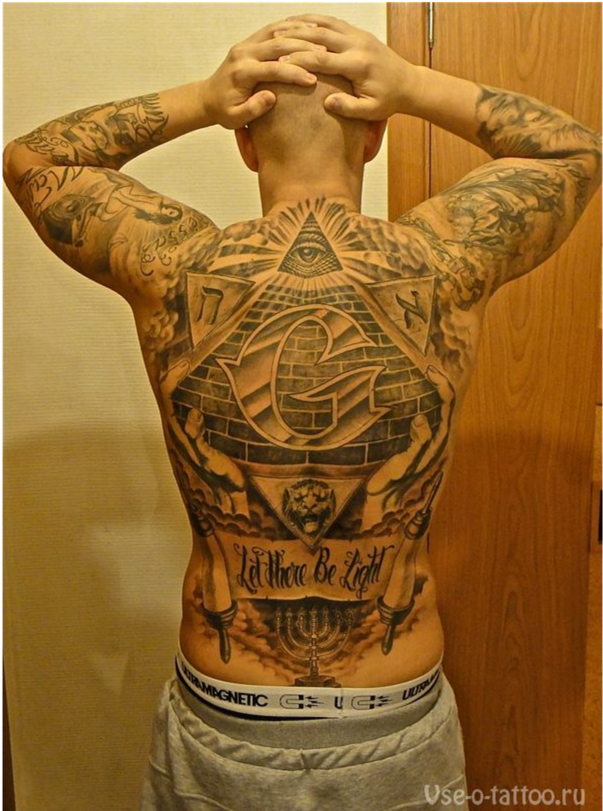
Недопевец Джиган — слуга антихриста, масонов, иллюминатов

Ну как вам, кошерные татуировки? Цитата с одного сайта: